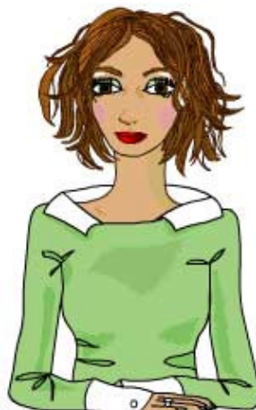
Den interaktiva assistenten på Humanys hemsida, Amanda.